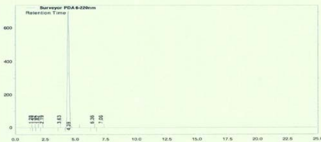
Area Percent Report - Sorted by Signal

Column: Purospher RP 18e 5 μm, 125 x 4 mm Conditions: 1.0 ml/min, 40 °C Water/Acetonitrile 60/40 (v/v); 0.1 % H 3 PO 4 Detector: DAD 220 nm Injector: Auto 13 μl; 0.0356 mg/ml in Water/Acetonitrile 50/50 (v/v)