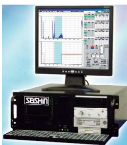
AE品質・設備診断システム