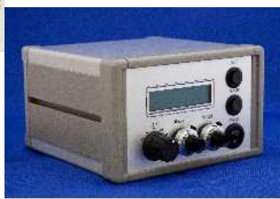
簡易AE診断ユニット