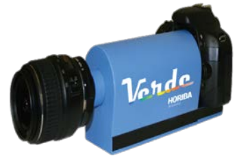
分光イメージングカメラ