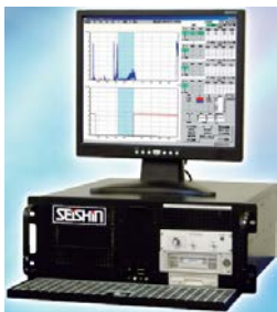
AE品質・設備診断システム