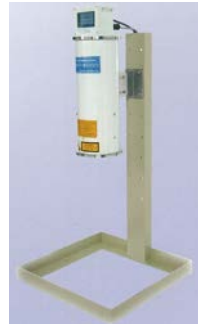
レーザ走査式油膜検知器