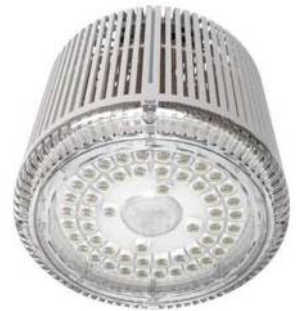
高出力&省エネLED照明