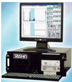
AE品質・設備診断システム