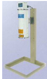
レーザ走査式油膜検知器